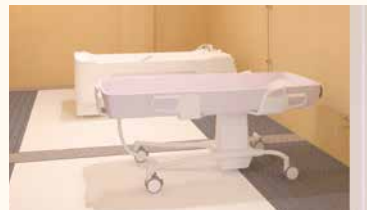
特殊浴槽、ストレッチャー式浴槽